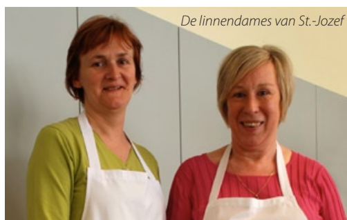
De linnendames van St.-Jozef