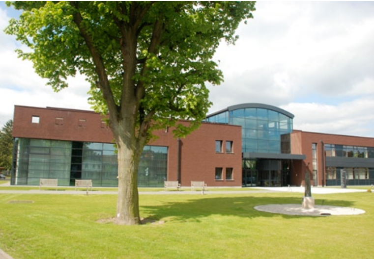
St.-Jozef Munsterbilzen: het administratieve centrum