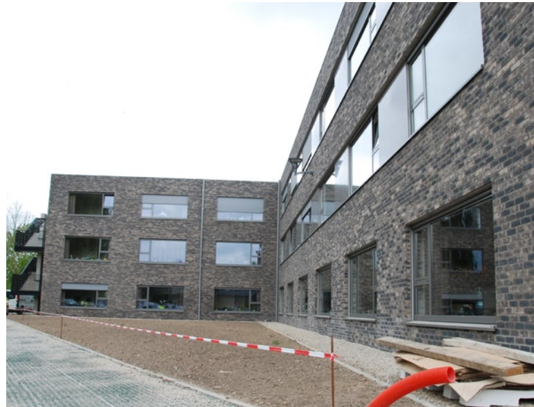
Het moderne rusthuis in de finale bouwfase.

Alle vormen en gradaties van fysische, mentale en sociale zorgbehoefendheid zijn welkom in het Prielshof. Zo beschikt het woonzorgcentrum bijvoorbeeld over een gesloten afdeling, waar dementerende bewoners met wegloopgedrag veilig kunnen wonen. Deze afdeling biedt plaats aan 26 personen.